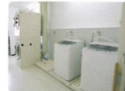
共同で使えます。洗濯室

お食事や体操、レクリエーションなども行われます。特殊な防火カーテンを採用しているので、安全です。